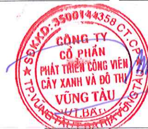
Chủ tịch Hội đồng quản trị Lê Huy Hữu Hiệp Tỉnh Bà Rịa - Vũng Tàu Ngày 17 tháng 03 năm 2025