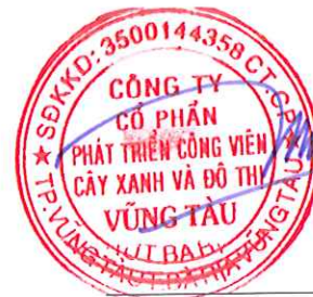
Chủ tịch Hội đồng Quản trị Lê Huy Hữu Hiệp Tỉnh Bà Rịa - Vũng Tàu Ngày 17 tháng 03 năm 2025