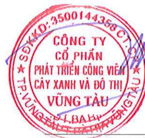
Chủ tịch Hội đồng Quản trị Lê Huy Hữu Hiệp Tỉnh Bà Rịa - Vũng Tàu Ngày 17 tháng 03 năm 2025